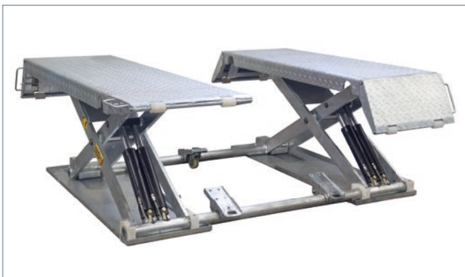
Feuerverzinkte Ausführung ATH-Flex Lift 30Z Artikelnummer: 680008-FZ