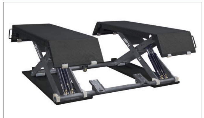
Pulverbeschichtete Ausführung ATH-Flex Lift 30 Artikelnummer: 680008