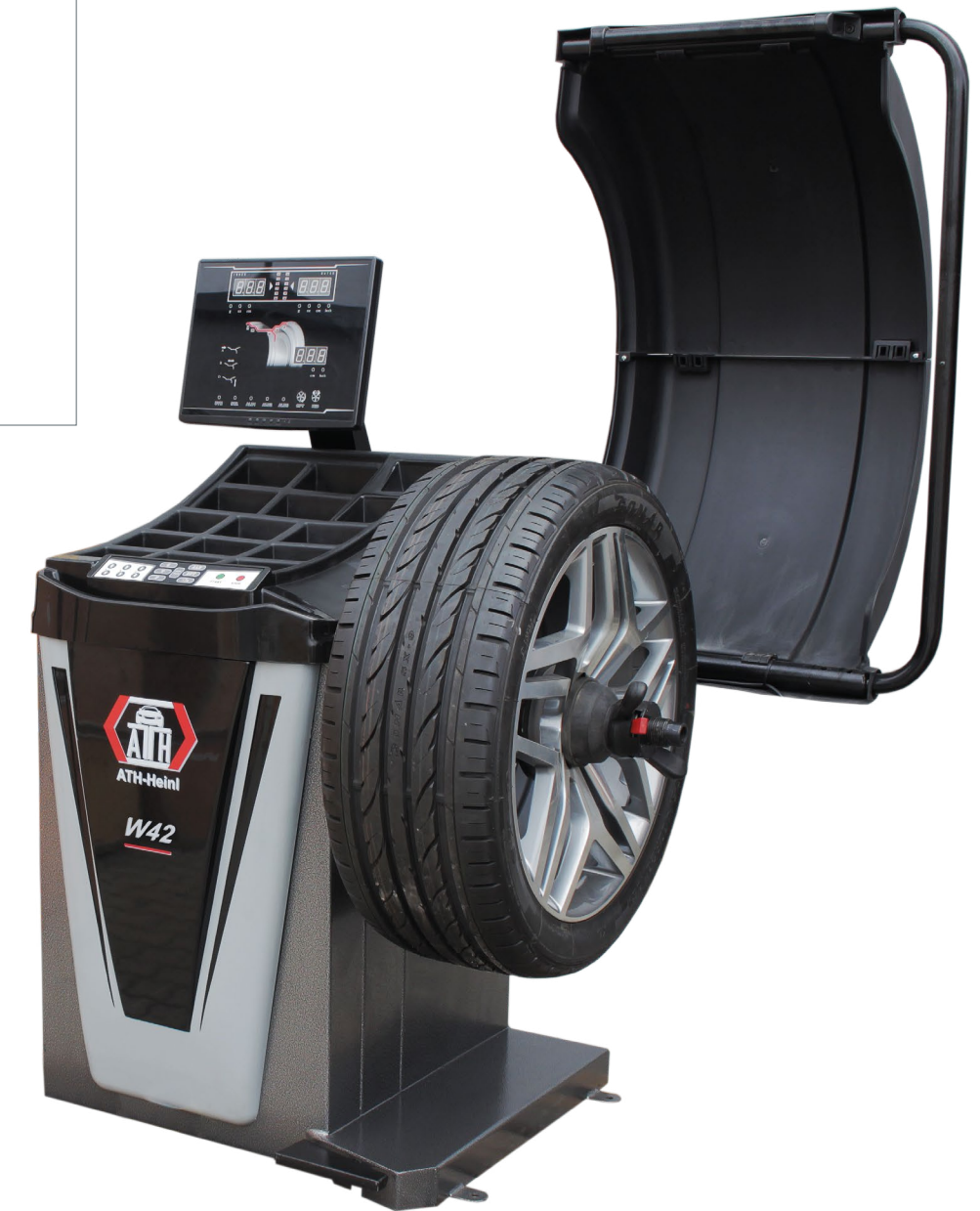
Zubehör auf Seite 87 Accessories on page 87 Accessoires page 87