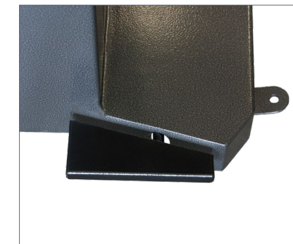
Pedalbetätigte Feststellbremse Pedal controlled wheel break Frein de blocage à pied